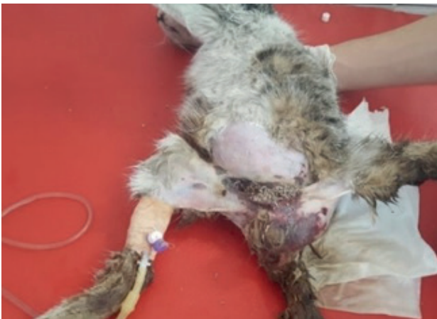
Resim 1: Travmatik miyaz şikayetiyle getirilen kedinin klinik görünümü

Cerrahi Kliniğine maddi doku kayıplı yara şikayeti ile agoni halinde getirilen tekir bir dişi kedinin muayenesi sırasında inguinal bölgenin özellikle anüse yakın kısımlarındaki lezyonlarda çok sayıda larvaya rastlandı. Larvalar lezyonlu bölgeden toplandıktan kısa bir süre sonra, kedi tıbbi bir müdahale yapmaya fırsat kalmadan ex oldu (Resim 1).